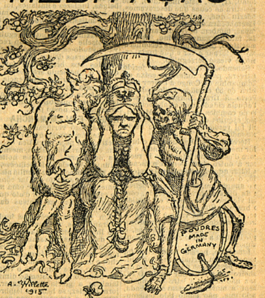
Uma bruxa de Napoles declarou ha semanas a um redator do Mattino que a Italia não entraria na guerra.

«Vi o céu cor de bronze, o que é sinal certo. Positivamente, não acredito que a Italia intervenha na guerra. Vejo soldados partindo para a fronteira, mas estou certa de que regressarão sem combater, porque o inimigo se declarou antecipadamente vencido.»