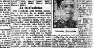
Portrait of a man, likely a political figure.